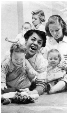
De Nursery en Nursery School van Helen Parkhurst. Deventer: Lectoraat daltononderwijs.

De jongste kinderen waren vijf maand. 15