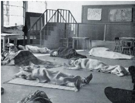
[3. Kinderen doen een middagslaapje]

In 1932 bestaat de 'primary department' van de Dalton School uit negen groepen. Er zijn twee 'nursery classes', twee 'pre-primary classes', een 'first grade', twee 'second grades' en een 'third grade'. De Nursery School is er voor kinderen van 2 tot 4 jaar. De kinderen komen tussen 9.00 en 9.30 uur op school. Om 12.00 uur wordt er gegeten door de kinderen die ook 's middags blijven. Er is een slaapje tussen 12.45 uur en 14.00 /14.30 uur en van 14.30 tot 16.30 uur zijn er zoveel mogelijk 'out of doors'-activiteiten.